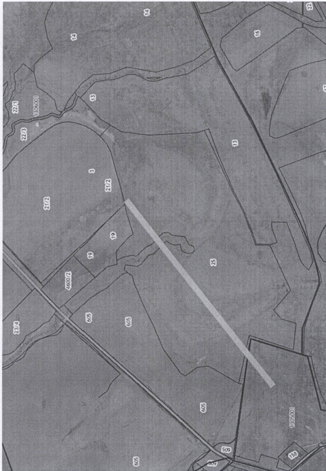
Схема расположения публичного сервитута сооружения «Строительство отпайки ЛЭП-10 кВ от опоры №500/73 ВЛ-10 кВ фидера ЕЛШ-5 до устанавливаемой КТП 10/0,4 кВ, установка КТП мощностью 160 кВА строительство ЛЭП-0,4 кВ до границ участка заявителя в Сергиевском районе Самарской области ( в 5 км юго-западнее с. Елшанка) (Овчинников А.Н.)»